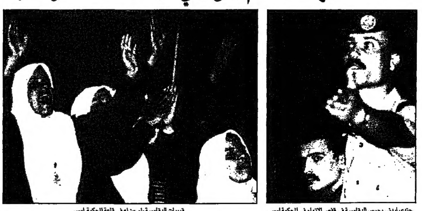
جندي لبناني يحرس النقاسية في قفص الاتهام في المحكمة امس

قربت هيئة لتكملة بناء على طلب النيابة، لائحة النقاسية في المحكمة العسكرية لجنود احرى صامحة لخصائص شخصيته بتمهة صياغة الفرار، وقد حصل عقوبة هذه بالجدة الى السجن لمدة ثلاث سنوات. وكانت النيابة العسكرية وجهت الى النقاسية اربعة تهم على انها ماقت العمد مع سبق الاصرار، التي قد حصل عقوبتها الى الاعدام في حال ثبوتها. وفي معرض شهادته كشف للتهمة انه حاول الانتحار عدة مرات في وقت اخر من التشنجات عن طريق جرعة زائدة من الدوية او رمي نفسه من سطح منزله بسبب مشاعر عناء. واشار الى تعرضه لتوترات من الغضب من بينها تلك التي قدم عليها على تطعيم جنود كلفون في منزل بعلبك، كما تحدث عن تعرضه لخنازير قفاز اوعى قبل سنوات، وسعى مثل النفاق الى الربط بين تلك الحالات وبين تأكيدهم بانته لا يتكرر شيئا من حادثة اطلاق النار. وفي معرض وصفه للحظات التي سبقت الهجوم، قال النقاسية انه سمع صوت قنبلة وضخ عندما كان يصلي في غرفة من المساحات الاسرائيلية في الباقورة، وقال عندما انهيت الصلاة لاجتذاب حركات واشارات من قبل القنايات اللاتي قامت بعرضهن باللقاط سوريا لي. اضاف قائلا انكر انني فتحت باب مركبتي للنفق ولحققت بالبنديفة وصوت اطلاقا في مكتب التحقيق في الشرطة النمامية (واحد الاربع). وعندما سئل لماذا لم يطلب من التوقف فور تهيئة له في المحكمة امس.